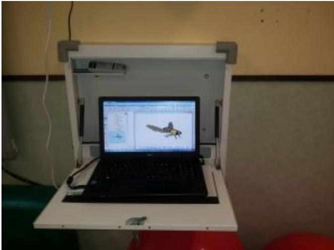
Pc portatile e armadetto a muro

Progetto 10.8.1.A3-FESR PON-PI-2015-282 - CUP B96J15001630007